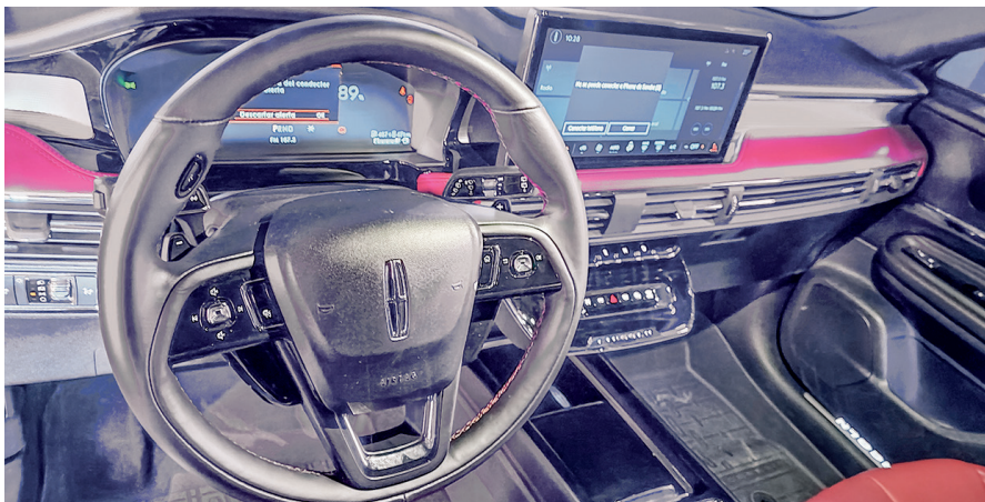
Panel de instrumentos digital rediseñado y pantalla central de 13.2 pulgadas