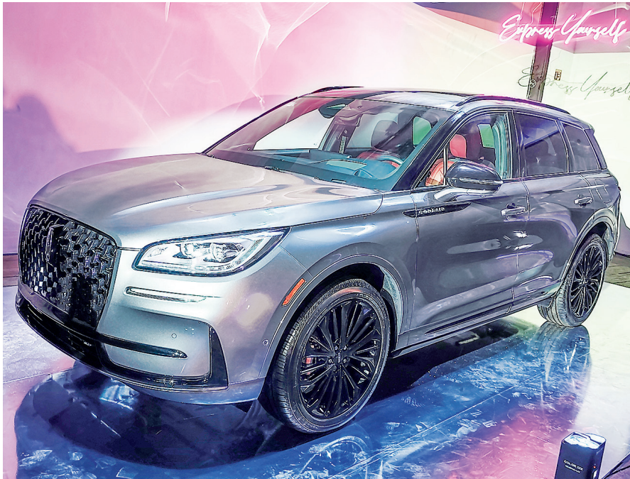
Faros con iluminación LED en forma de alas y nuevos rines de 20 pulgadas

Carrocería con aspecto más limpio y moderno hasta en ocho colores